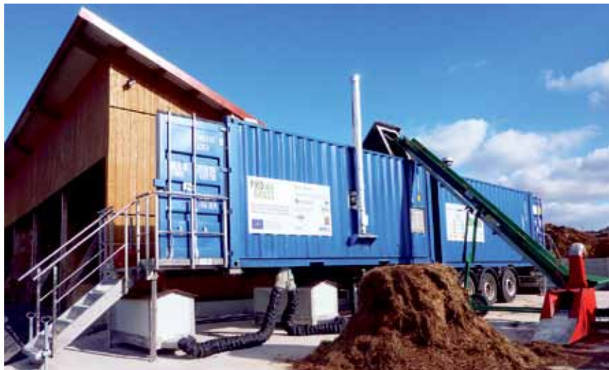
Mobiles Prototyp der IFBB-Anlage.