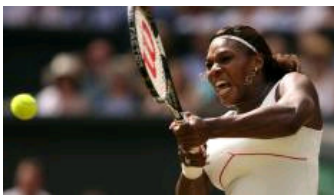
Uurimuses «viljakaks röögatajaks» nimetatud Serena Williams olla väitnud, et teda vastase häälitsused küll ei sega.